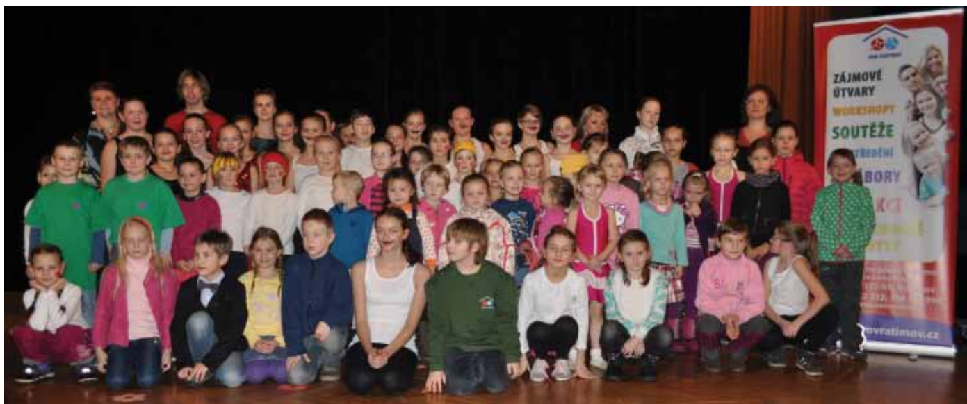
... Gala přehlídka kroužků DDM Vratimov, pobočky Paskov a Řepiště ...

Uvedené kroužky můžete nezávazně 1x navštívit.