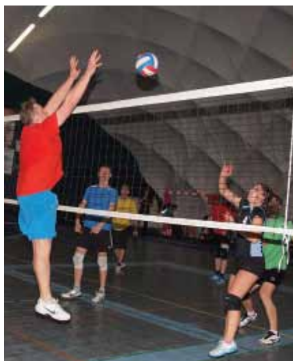
... volejbalový turnaj ...

V rámci oslav města paskova jsme pořádali v červnu turnaj na školním hřišti. I tento je již tradiční a má pevné místo v kalendáři sportovních akcí volejbalových smíšených amatérských družstev v širokém okolí. Počasí bylo nádherné a byl to také již minimálně 10. ročník :-).