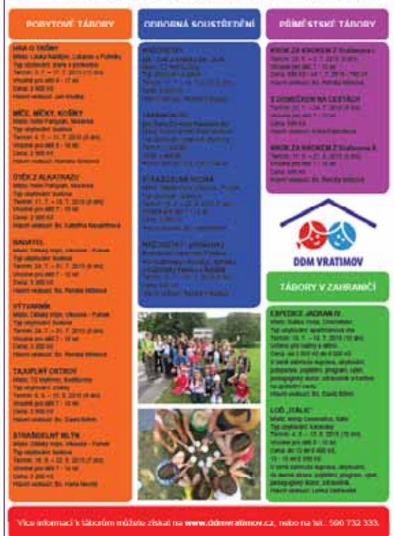
Nabídka letních táborů a odborných soustředění DDM Vratimov na léto 2015

Z letošního výtěžku plánujeme zakoupit zvedák pro imobilní klienty na Oáze pokoje, financovat