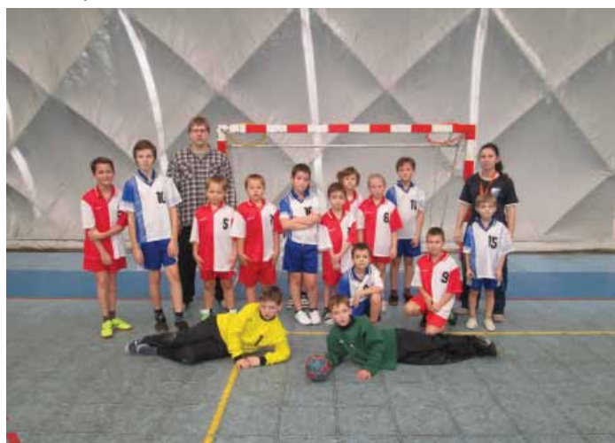
... turnaj O vánočního kapra ...

Od 9h do 11h byl naplánován turnaj minižáků. Družstva byla různorodá a byli v nich jak úplní nováčci, tak i zkušení hráči. Nejmladšímu hráči, který nastoupil do utkání, bylo 5 let. Turnaje se účastnily týmy Paskova A (modří), Paskova B (červení), Krmelína a Frýdku-Místku. Po každém utkání následovaly dovednostní soutěže, ve kterých děti ukázaly, jak umí driblovat, přihrávat, střílet, trefovat cíl a jakou mají koordinaci při slalomových disciplínách. Při celém turnaji nešlo ani tak o výsledky, kdo vyhrál nebo prohrál, kdo byl lepší nebo horší, šlo především o zábavu a o to ukázat dětem, jakou mohou získat radost z pohybu a ze hry samotné.