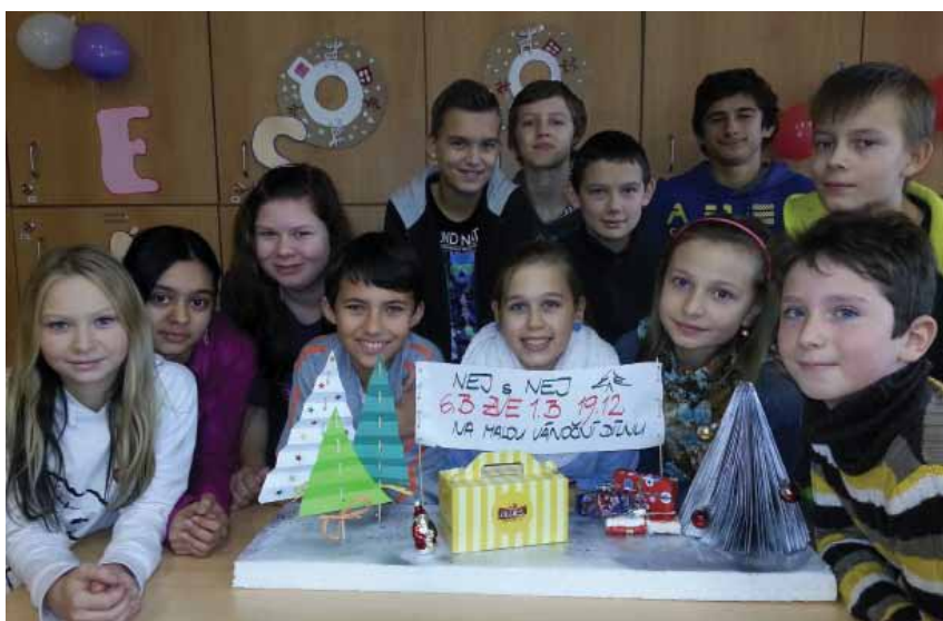
... Nej s Nej ...