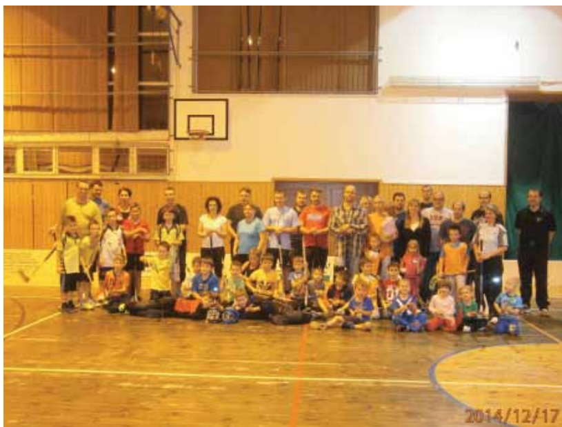
... florbal pro maminky a tatínky ...

Bylo velice zajímavé, že nejenom děti se snažily na dospělé (především na rodiče) vytáhnout, ale dospělí to vzali velmi vážně a svým ratolestem vůbec nic nedarovali. Výsledek nás velmi překvapil. Všichni bez výjimky si chtějí toto setkání co nejdříve zopakovat a já doufám, že i příště bude účast bez nadsázky masová (viz foto z akce).