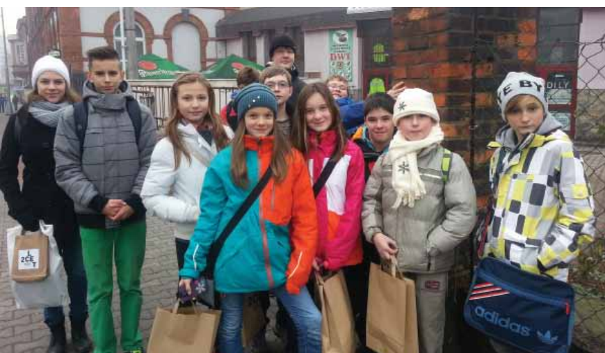
... žáci základní školy ze soutěže Zlatá cihla ...