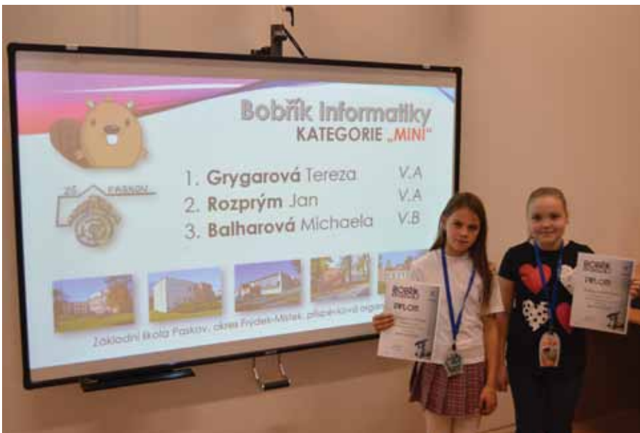
„Bobřík informatiky v kategorii mini“

Každý soutěžící začíná se startovním počtem 60 bodů, maximální počet bodů, které lze v soutěži získat, je 240 bodů. U kategorie Mini je však méně otázek, proto je startovní počet 48 bodů a maximální počet 192 bodů. Úlohy jsou rozděleny do tří skupin: lehké, střední a těžké. V případě, že soutěžící na otázku neodpoví, neztratí žádný bod. Pokud však odpoví špatně, body se odčítají. Za správnou odpověď se body samozřejmě přičítají. Každý soutěžící může test absolvovat pouze jednou. Každá kategorie se může uskutečnit pouze v termínu určeném pro celonárodní soutěž. Poté jsou testy uzavřeny.