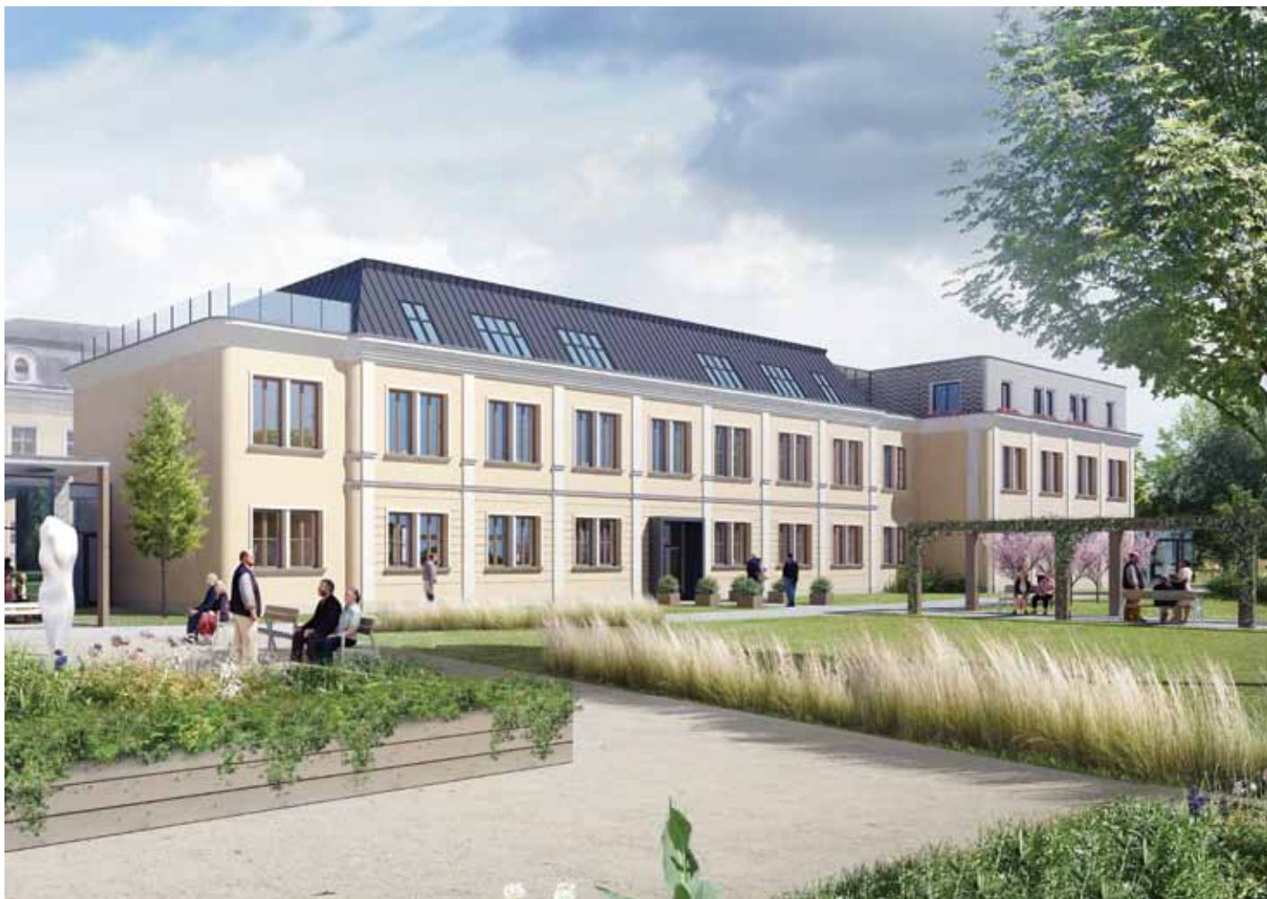
„Vizualizace „Seniorského bydlení“ v Paskovském zámku“