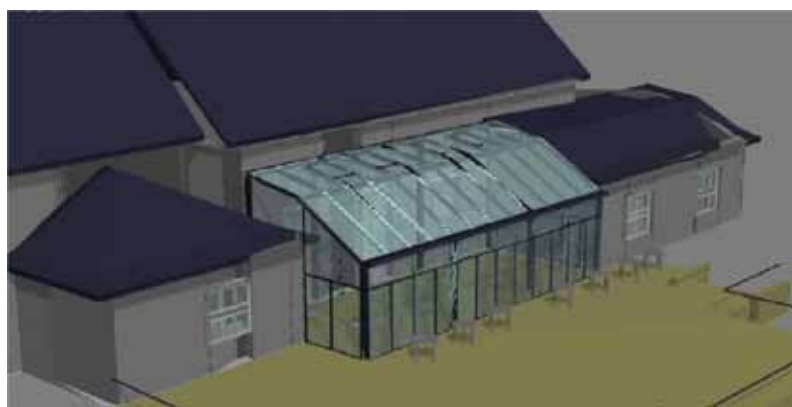
„Vizualizace „Zimní zahrady“ u KCP.“