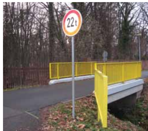
„Most na ulici Mírové, za kinem“