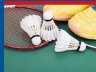
Badminton na ZŠ čtěte na str. 24