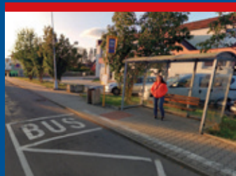
Změny MHD na Kirilovově ulici čtěte na str. 5