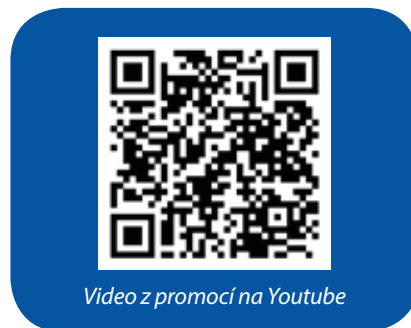
Video z promocií na Youtube